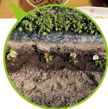
畑で野菜を育てています

休日をこのように過ごすことで、身も心もRefresh & Power充電となり、「明日からまた頑張ろう!」という気持ちになります。