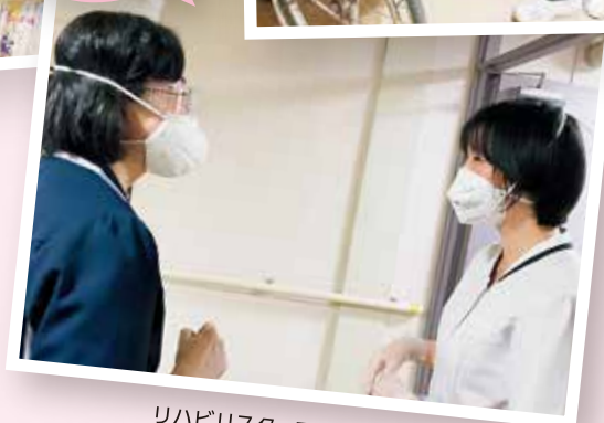
リハビリスタッフと日時調整

私は昔から読書が大好きです。今回は特におすすめの作家さん、作品を紹介したいと思います。