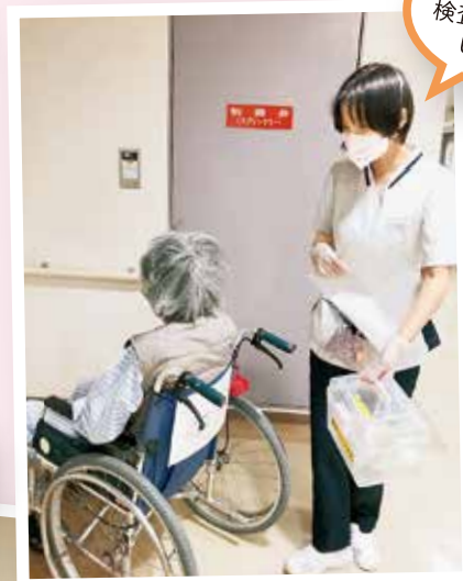
心電図の検査に行きましょうね