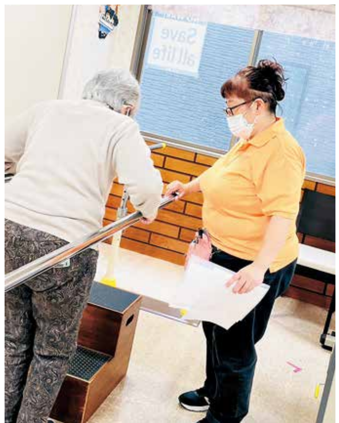
自宅での生活ができるようにリハビリしている様子です

時の私たちのビタミン剤です。笑顔をもらうにはまず対話だと思います。みなさんも患者さまといっぱいお話してくださいね!!