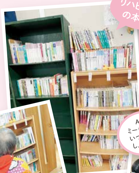
リハビリ室の本棚