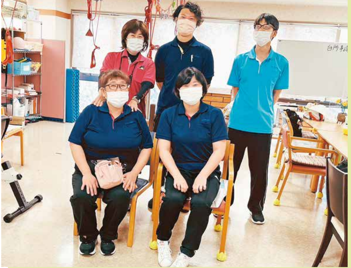
一緒に働く仲間です

の笑顔になります。ご家族にデイサービスでの様子をお伝えすると、ご家族も安心され喜ばれました。デイサービス中は、体調不良があってもご自身で訴えができないため、表情や様子を見て「大丈夫よ」と声かけし、手を握っていると安心した笑顔が見られます。利用者さまが安心されると、私たちも笑顔になります。