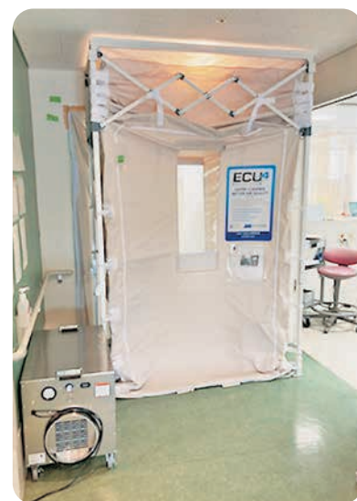
空気感染隔離ユニット「ミンティ」。病室前に設置し、陰圧となる前室をすることで廊下へ感染した空気が流れ込むのを防止します。

看護学生の皆さんにも、自分の興味のあることなどは失敗を恐れず前向きに取り組んでもらえたらとても嬉しいです。一緒に頑張っていきましょう！