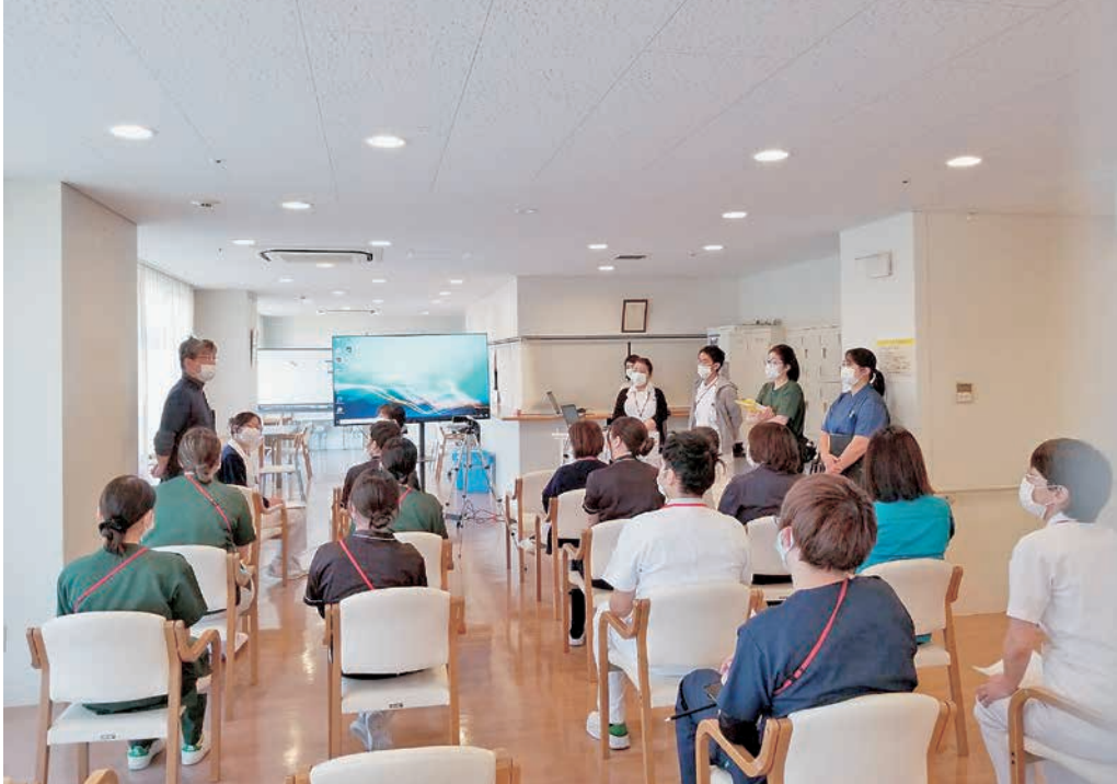
コロナ病棟開設時の研修の様子

ました。特に入職後、新型コロナの影響で面会などが制限されていた期間が長かったために患者様家族との関わりの経験が浅く、退院調整における面談や合同カンファレンスの開催に対して的確な介入ができるのかという点に強く不安がありました。「まずはやってみよう」という気持ちを大事にして行動することを意識しました。患者様本人とご家族の意向が噛み合わなかったり、カンファレンスの中で急に翌日の退院が決まってバタバタしたりと大変だなと感じることはたくさんあります。しかし、患者様が「ありがとうございました」と退院していく姿を見ることができた時は達成感を感じることができます。