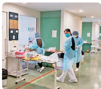
PPEを着用し患者様の元へ

私が尼崎医療生協病院に入職したのは2020年4月のことでした。世間では新型コロナの流行による緊急事態宣言が初めて発令された頃です。病棟でのクラスターを経験し、2年目からは新たに創設されたコロナ病棟で勤務しました。4年目になる頃にコロナ病棟は閉鎖となり、現在の病棟で働いています。