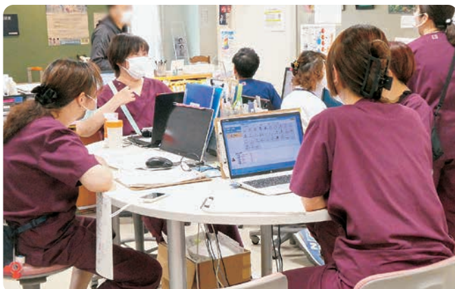
朝のカンファレンスの様子